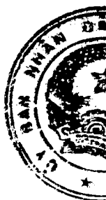
Bảng 2: Diện tích đất cần thu hồi trong kỳ Kế hoạch năm 2018 (Kèm theo Quyết định số: 809/QĐ-UBND ngày 06 tháng 4 năm 2018 của Ủy ban nhân dân tỉnh Kiên Giang)